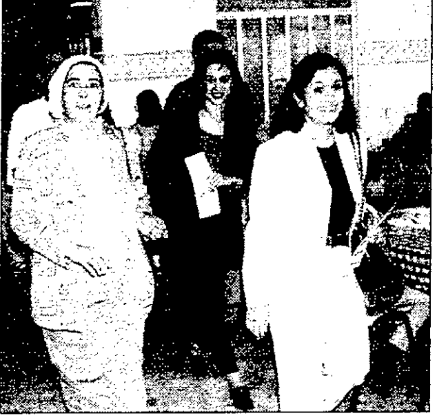
سمو الاميرة ثروت والاميرة رحمة